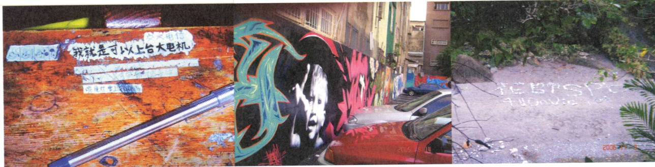
左圖： 「我就是可以上台大電機。」從教室課桌椅上的塗鴉可以看到學生的升學壓力。