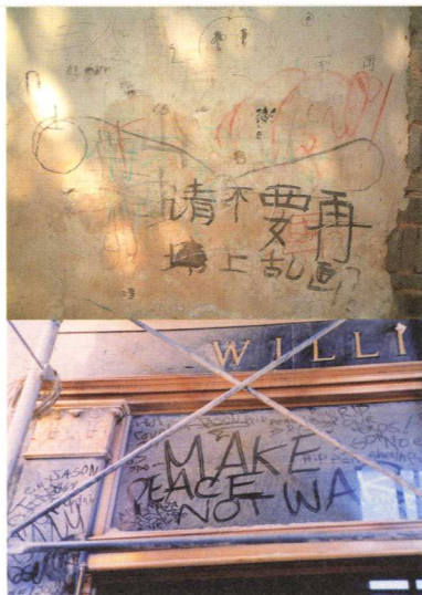
上圖： 中國宏村的塗鴉：請不要在牆上亂畫。