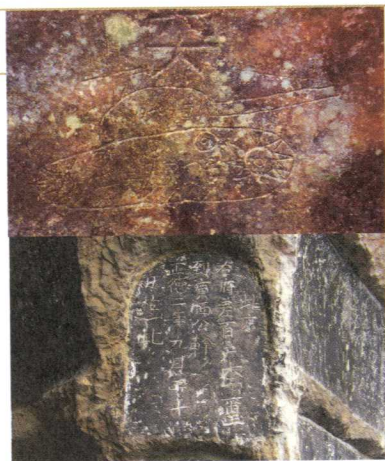
上圖： 高雄鄉間，據說是駐守軍隊無聊時在石頭上刻出的塗鴉坦克。