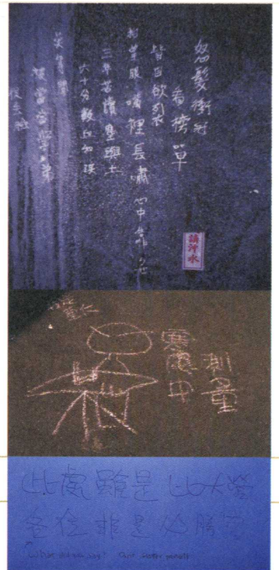
上圖： 建中廁所隔間內的塗鴉，將岳飛的滿江紅改寫，反映高中生的考試焦慮。

塗鴉，儘管是一個人封閉的廁所間塗寫，也經常不是個人的喃喃自語。一方面他預設了會有不同的讀者，一方面塗鴉經常引來塗鴉，而產生眾生喧嘩的景象。塗鴉也是對權威的雙重挑戰，從內容而言，它表現了禁忌的想法或是語言；從空間而言，它也破壞了其他人或公共的財產。