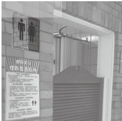
圖二：世新大學舍我樓四樓性別友善廁所外觀