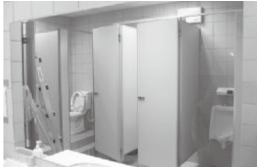
圖一 世新大學傳播大樓地下三樓之性別友善廁所